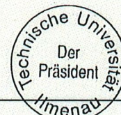
Univ.-Prof. Dr.-Ing. habil. Kai-Uwe Sattler Präsident

..... Der genehmigte Haushaltsplan wird gemäß § 5 Abs. 3 ThürStudFVO im amtlichen Verkündungsblatt der Hochschule bekanntgegeben.